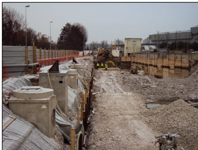
27/12/2010 : futur By-pass posé sur la gauche et terrassements

Les travaux de reconstruction de la station d'épuration ont commencé en septembre 2009 par la mise place des installations de chantier. La future canalisation de by-pass a été posée fin septembre. La démolition d'une partie des bâtiments existants a été réalisée en fin d'année. Les travaux de terrassements et les blindages nécessaires ont débuté en novembre.