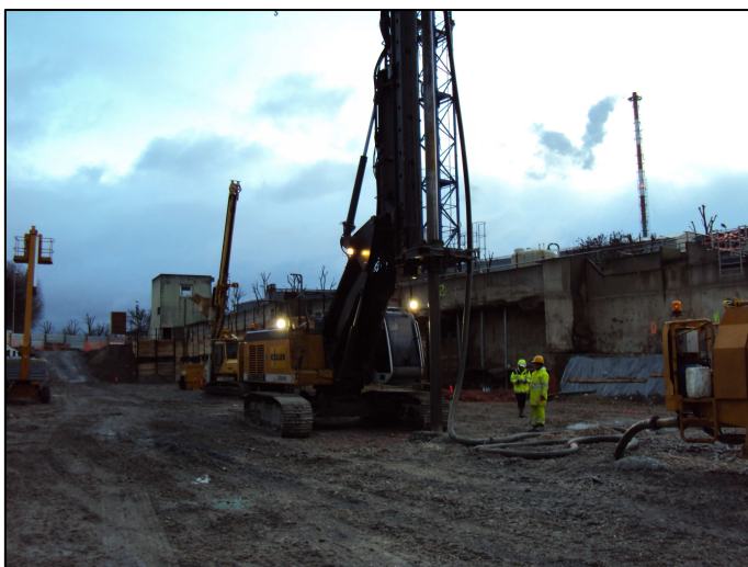
03/02/2010 : Réalisation d'une CMM

Le chantier a été arrêté une quinzaine de jours pour intempéries du fait des faibles températures des mois de décembre et janvier.